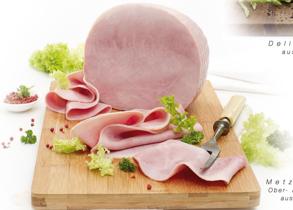
Metzger-Premiumschinken Ober- & Unterschalen mit feiner Fettkante, aus dem Netz, in großer ovaler Form