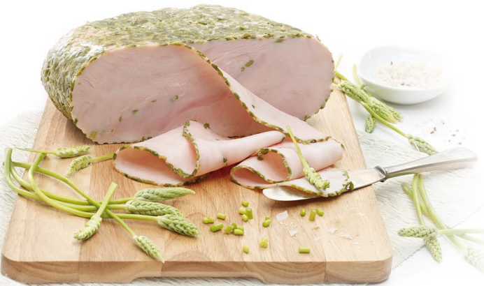
Spargel-Truthahnbrust aus gewachsenen Filets, handgelegt

Etablierte Qualitätsprodukte aus dem Schinken oder der Putebrust: Ideal für die klassischen Spargelröllchen, als starke Ergänzung in der gut sortierten Theke oder dem saisonal angepassten Buffet.